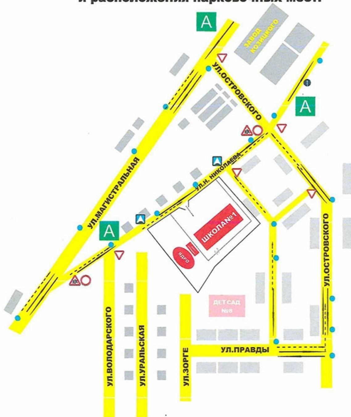
Схема организации дорожного движения в непосредственной близости от образовательного учреждения с размещением соответствующих технических средств, маршруты движения учащихся и расположения парковочных мест.